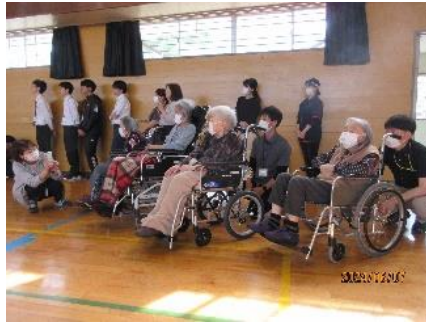
福祉施設の方も応援♡