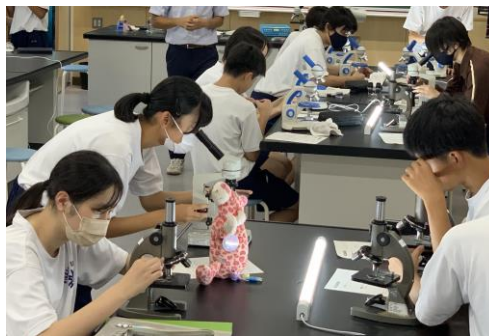
授業も再開。顕微鏡で何が見えたかな？

東翔祭の後に控えているのは新人戦です。運動部に所属している1・2年生にとって、3年生引退後に迎える大きな大会です。短期間で実力が高まることはありません。約1か月後の大会に向けて、毎日コツコツと練習を重ねていきましょう。頭を使って練習することが上達の秘訣です。