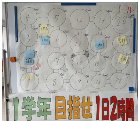
学年で決めた目標に向けて頑張る！

いずれも、明確な「目標」を設定するとともに、その活動を通してどんな自分や自分たちになりたいか、つまり「目指す姿」を設定して、その達成に向けて努力することが大切です。得点や順位など、数値や結果として表れる目標を励みに努力することも大事。そしてそれ以上に、自分や自分たちをどのように高めたいか、成長させたいかを意識し、理想とする自分や自分たちの姿に迫るための努力を重ねることが大切です。これからの生き方にも大きくかかわってくる「目指す姿」に向けた努力を、粘り強く行っていきましょう。