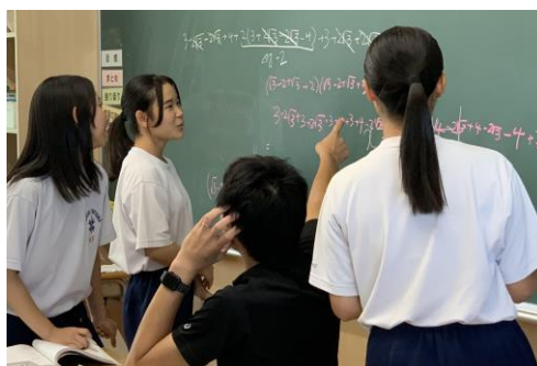
テストに向けて、先生に質問！